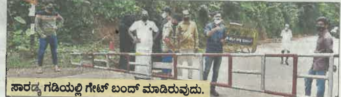
ಸಾರದ್ಯ ಗಡಿಯಲ್ಲಿ ಗೇಟ್ ಬಂದ್ ಮಾಡಿರುವುದು.