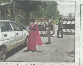
ಅಡೂರು ಗಡಿಯ ಬಳಿ ಬಿಗು ತಪಾಸಣೆಯಲ್ಲಿ ತೊಡಗಿರುವ ಪೊಲೀಸ್ ಹಾಗೂ ಆರೋಗ್ಯ ಇಲಾಖೆ ಸಿಬ್ಬಂದಿ.

ಸುಳ್ಯ: ಕರ್ನಾಟಕ-ಕೇರಳವನ್ನು ಬೆಸೆಯುವ ಮಂಡೇಕೋಲು ಗ್ರಾಮದ ಅಡೂರು ಗಡಿಯ ಬಳಿ ತೀವ್ರ ತಪಾಸಣೆ ನಡೆಸಲಾಗುತ್ತಿದೆ. ಕೇರಳ-ಕರ್ನಾಟಕದ ನಡುವೆ ಬಸ್ ಸಂಚಾರ ನಿರ್ಧಾರದಿಂದ ದಕ್ಷಿಣ ಕನ್ನಡ ಜಿಲ್ಲೆ ಹಾಗೂ ಕಾಸರ್‌ಗೋಡು ಜಿಲ್ಲೆಯ ಗಡಿ ಭಾಗದಲ್ಲಿ ವಾಸಿಸುವವರು ಕಷ್ಟ ಪಡುವಂತಾಯಿತು. ಗಡಿಭಾಗಗಳಲ್ಲಿ ವಾಸಿಸುವ ಕಟ್ಟಡ ಕಾರ್ಮಿಕರು ಕೂಡಾ ಗಡಿ ಭಾಗಗಳಲ್ಲಿ ನಂಚರಿಸಲು ನಿರ್ಬಂಧವಿರುವ ಕಾರಣ ತೊಂದರೆ ಅನುಭವಿಸುವಂತಾಯಿತು. ಕೇರಳದಿಂದ ಅಗಮಿಸುವವರು 72 ಗಂಟೆಯ ಒಳಗಿನ ಕೋವಿಡ್ ಪಾಸಿಟಿವ್ ವರದಿ ನೀಡುವುದು ಕಡ್ಡಾಯವಾಗಿದ್ದು, ಇದನ್ನು ಕಟ್ಟುನಿಟ್ಟಾಗಿ ಜಾರಿಗೊಳಿಸಲಾಗಿದೆ.